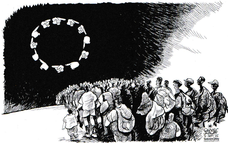
Karikatur: Oliver Schopf, 4.9.2015